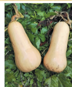
バターナッツカボチャ P.N. 安室波平さん