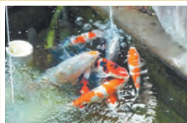
順番待ちの鯉たち