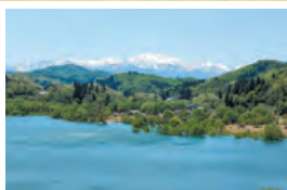
飯豊連峰と水没林 P.N. LLPさん