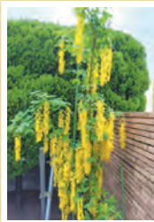
黄色の藤の花 みつけました P.N. エイチちゃんさん

組合員の皆さまから投稿いただいた写真を紹介します! 「今日はこんなことがあった」など皆さまの投稿をお待ちしております!