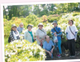
寒河江公園つつじ園でウォーキング

“じょいふる”のメンバーは今のところ10人位しかいないので行事は皆で考え楽しく活動をしています。その中でも歌声(生の演奏)は好評なので回数を増やそうとしています。健康づくりも大事なので悩みどころです。これからも皆で考えながら楽しく活動していきたいと思っています。