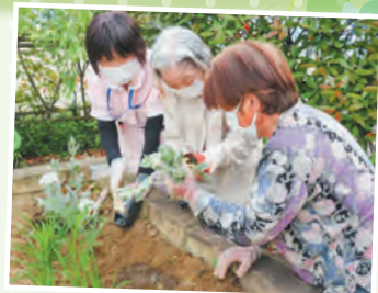
利用者さんと園芸している様子

協立リハビリテーション病院デイケア室は、介護福祉士14名、介護職（半日）2名、リハビリ技士8名（兼務）、看護師2名で看護、介護、リハビリを提供しております。障害を持つ方や、高齢者の方々の日常生活動作の維持・向上を図りながら『昨日より元気に!』をデイケア目標に掲げ「自立支援」「楽しみづくり」や「生き