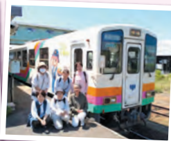
フラワー長井線体験ツアー