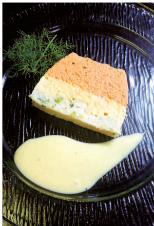
全国医療研で提供した「鶴岡の地元食材三色テリーヌ」