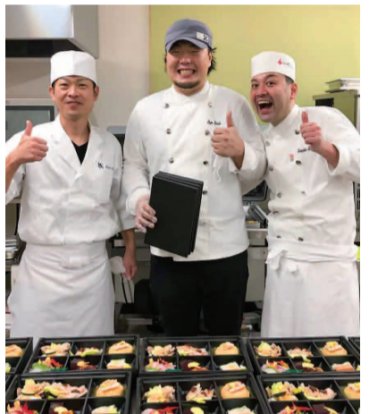
鶴岡市食の名誉大使達と加茂水産高校生徒たちへのお弁当作り