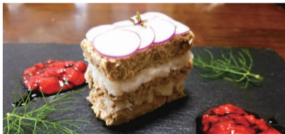
審査員特別賞を受賞した「藤沢カブと庄内豚のミルフィーユ仕立て」