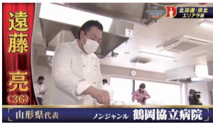
山形県代表として料理大会に出場