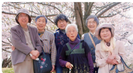
お出かけ班会のお花見の様子

医療生協のスタッフの皆様、いつもご指導ありがとうございます。「健康づくりチャレンジ」への誘いを受けて先ず思うのは、普段の生活に負担なく出来ることを第一に選んでいます。