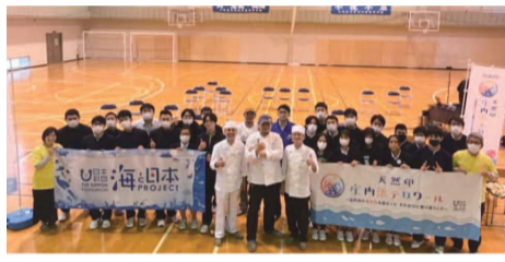
加茂水産高校で生徒に授業