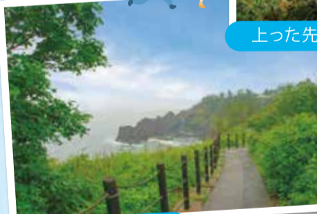
遊歩道からの絶景!