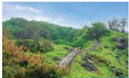
上った先には絶景が待っています