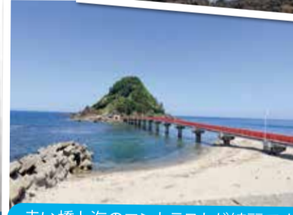
赤い橋と海のコントラストが綺麗です