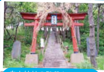
白山神社の階段を上るのも良い運動に!

また島内にはヨモギ、イタドリ、ウコギ等の食用植物や、楓、松等に加えて季節の花を鑑賞できる場所もあり、色々な楽しみ方が出来る島です。