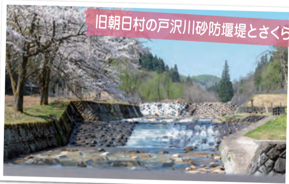
旧朝日村の戸沢川砂防堰堤とさくら