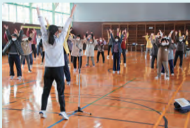
ノリノリズム体操

新たな軽スポーツを体験し、地域の健康づくりにつなげようと2月24日、「第1回健康フェスタin村山」を山形県体育館で開催。冬季でしたが87人が参加しました。参加者は、4つの体験コーナーを自由に廻ってチャレンジです。[ポッチャ]は初めての人が多く、順番を待つ人の輪ができました。「何十年ぶりよ」と[輪投げ]、[スカットボール]は「カーンと音がしてスカットするから?」、[けん玉]では「これはスクワットだね」…どこも和気あいあい、各コーナーの様子が伝わってきます。最後を飾る支部対抗「靴下玉入れ」は童心に帰っての熱戦にひときわ声援が館内に響きました。多くの参加者から「楽しかった」「また参加したい」「支部でもやってみたい」の感想が出されました。この間、村山地域組合員が一堂に集まることのできなかつただけに、組合員交流ができてとても良い健康フェスタとなりました。