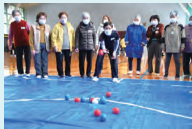
チーム対抗ポッチャ