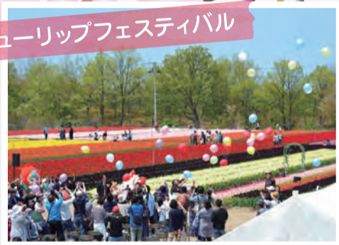
チューリップフェスティバル

遊佐町の中山河川公園です。家族と一緒に花見をした思い出の桜です。遊佐中学校の桜並木もとてもキレイです。