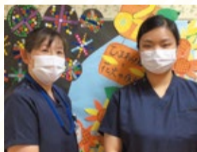
鶴岡協立リハビリテーション病院 2階南病棟