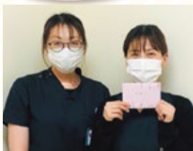
鶴岡協立病院3病棟

7月29日、全国の医療福祉生協連の仲間100人規模で「看護3年次研修会」がリモートで開催され、法人より2人の看護師が参加しました。