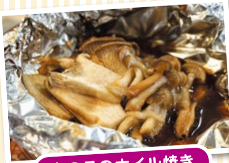
きのこのホイル焼き