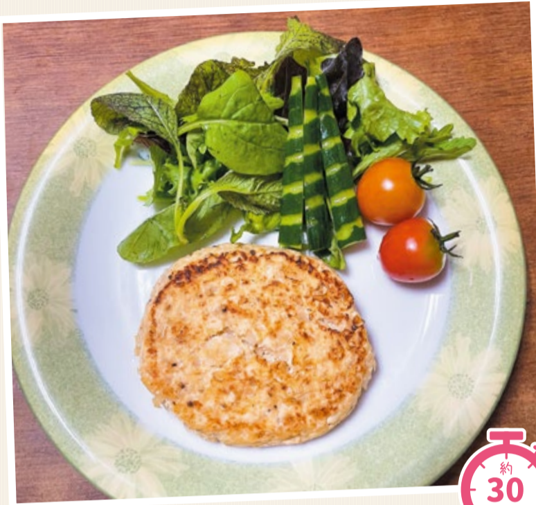
レシピ 鶴岡協立病院 栄養科 宮野 均