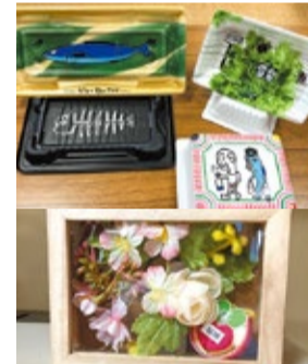
放課後子ども教室で作った作品

毎週3回、放課後子ども教室でサポーターをしています。親が迎えに来るまでの約3時間余りですが、宿題のアドバイスやグラウンド、体育館での遊びを見守り、サポーターしながら一緒に過ごしております。脳トレや筋トレになつていて1日1万歩以上になり、夜は途中で起きず朝までぐっすり寝られて幸せな生活です。