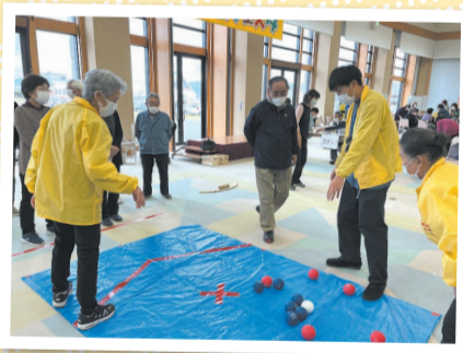
パラリンピックで話題のポッチャ