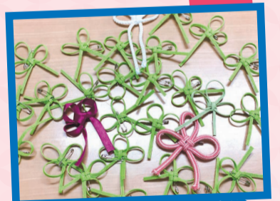
沢山のシトラスリボン ありがとうございました