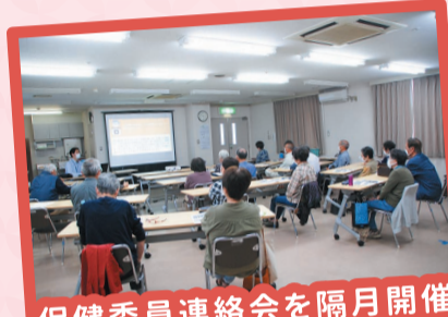
保健委員連絡会を隔月開催