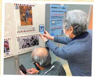
QRコードを読み取っていいね♡