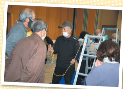
男結びってどうやるの?