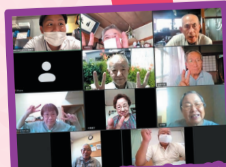
オンラインサークルが 「月三の会」に決定