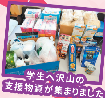
学生へ沢山の 支援物資が集まりました