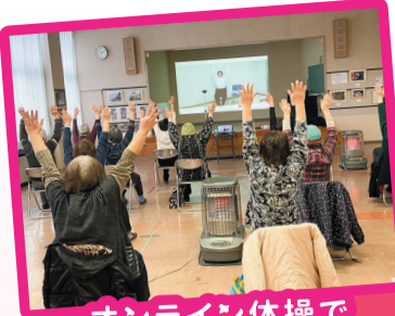
オンライン体操で 健康に