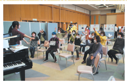
初めての音楽療法