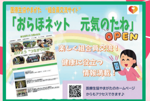
組合員交流サイト 「おらほねつと元気なたね」開設