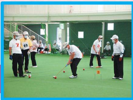
ゲートボール大会開催