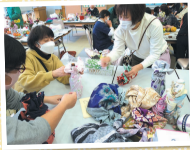
風呂敷包みに挑戦中!