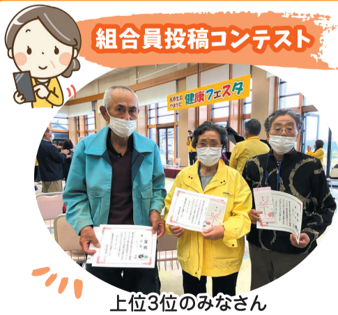
上位3位のみなさん