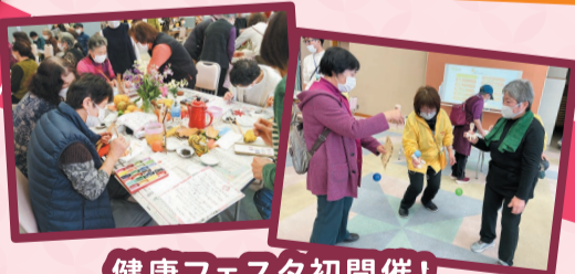
健康フェスタ初開催!