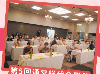
第5回通常総代会開催