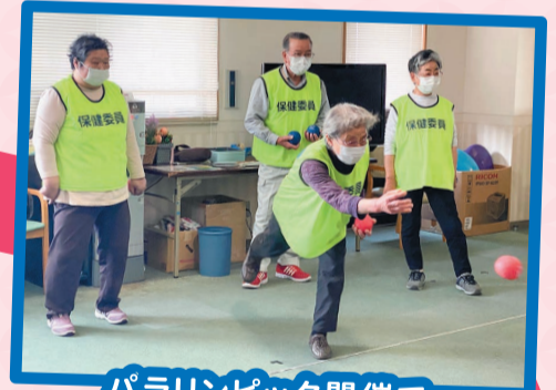
パラリンピック開催で ボッチャが注目