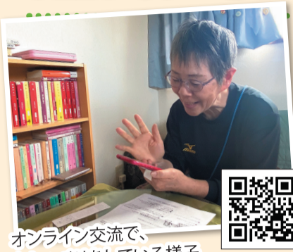
オンライン交流で、おしゃべりしている様子