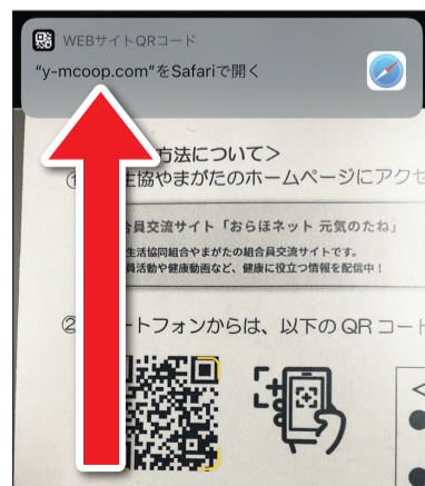
③URLが表示される/押す