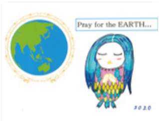
協立リハビリ病院 相談室

戦争のない平和な世界にするために、9条改憲を阻止し、憲法を守り平和と民主主義、非核日本への世論を大きく広げ、改憲の動きに警鐘を鳴らそうと各職場・協力団体に平和プラカード作成を依頼しました。今月号も引き続き作品を紹介していきます。