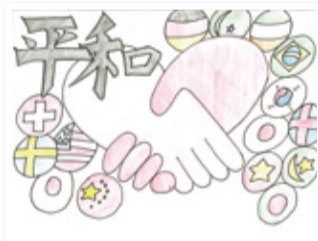
協立リハビリ病院 2南