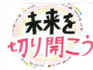
協立リハビリ病院 2北