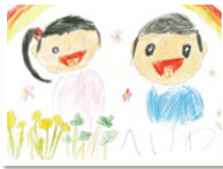
協立病院 デイケア