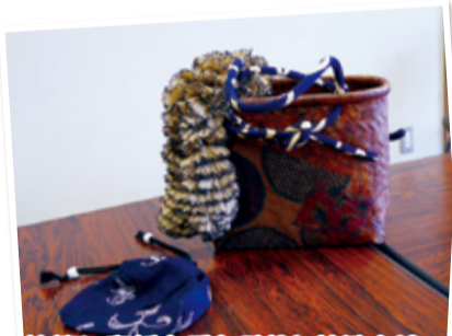
竹籠に和紙を重ね貼りし柿渋を塗って仕上げた「一閑張りかご」バック

幼い時から好奇心に溢れた子どもでも興味があることは直ぐに実行するほどでした。洋服学校の講師も務めました。帽子や小物を作つては楽しんでいますが、生協の趣味の会「さくらの会」でも色々と作つて楽しんでいきます。