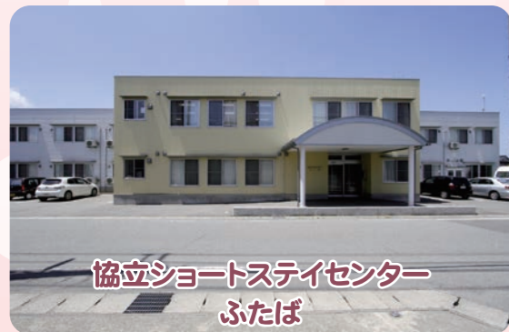
協立ショートステイセンター ふたば