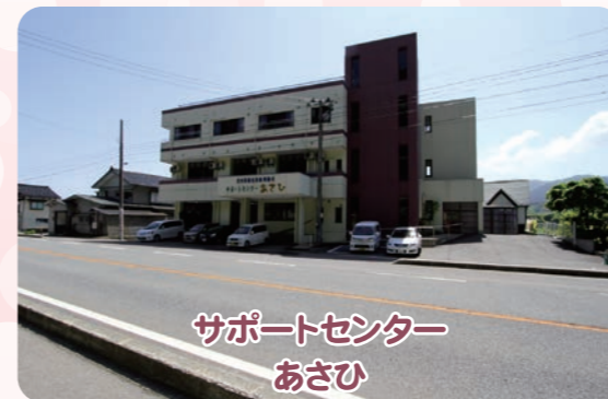
サポートセンター あさひ