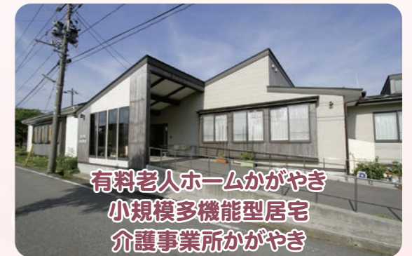
有料老人ホームかがやき 小規模多機能型居宅 介護事業所かがやき