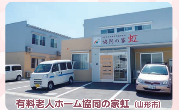
有料老人ホーム協同の家虹 (山形市)