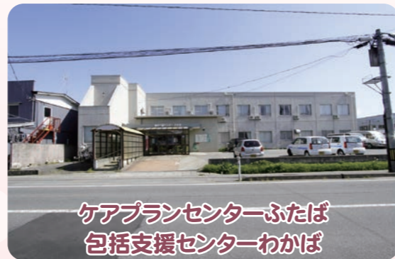
ケアプランセンターふたば 包括支援センターわかば