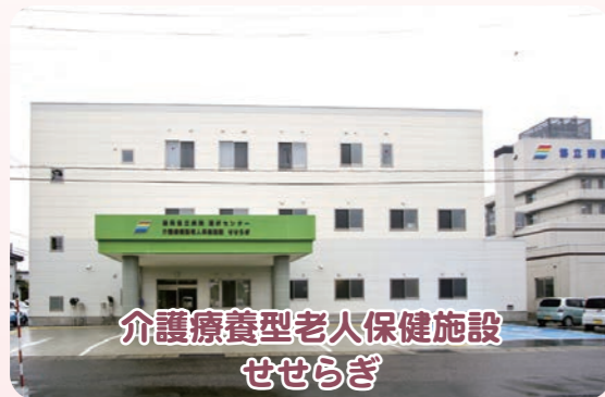
介護療養型老人保健施設 せせらぎ