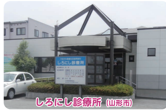
しるにし診療所 (山形市)