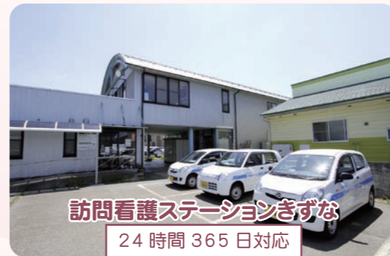
訪問看護ステーションぎずな 24時間365日対応