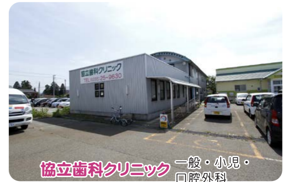
協立歯科クリニック 一般・小児・口腔外科