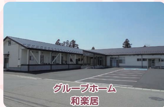
グループホーム 和楽居