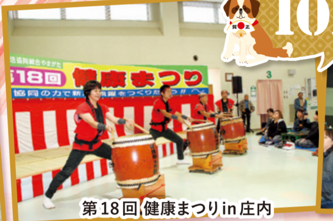
第18回 健康まつりin 庄内