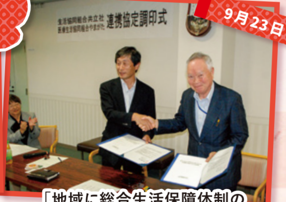
「地域に総合生活保障体制の 確立をめざす生協運動の 推進のための協定書」を 共立社と協定