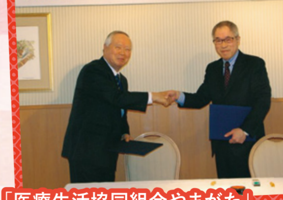
「医療生活協同組合やまがた」 誕生!