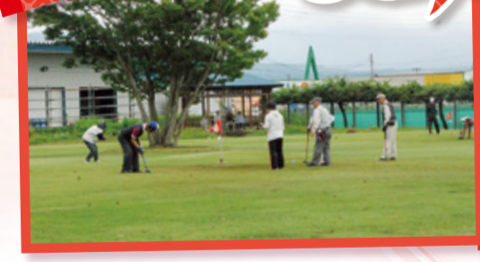
第12回 グラウンド・ゴルフ大会 藤島体育館広場