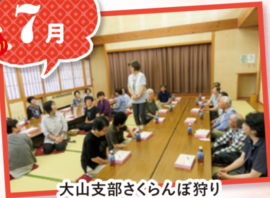
大山支部さくらんぼ狩り (天童支部組合員と交流)