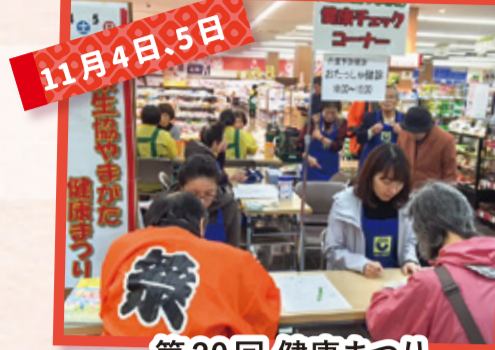
第20回 健康まつり (村山地域)