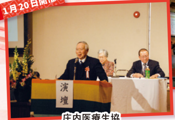
庄内医療生協 第57回 臨時総代会にて 統合を確認