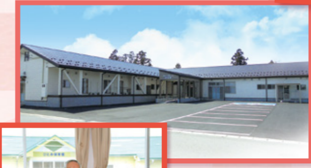
グループホーム和楽居 オープン

講演 「子どもの貧困の現状とこれから私たちがすべきこと」 浅井春夫氏(立教大学名誉教授) 日時 2018年1月13日(土)午後2時~4時30分 会場 鶴岡協同の家こびあ 2階ホール 参加費 500円 主催 庄内地域づくりと子育て文化・協同の会