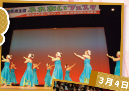
ふれあいフェスタ 鶴岡市中央公民館 (500人)