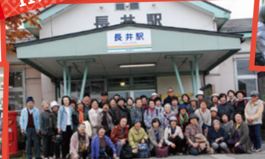
第1回 組合員ハイキング 43名が秋の長井線と米沢牛を堪能