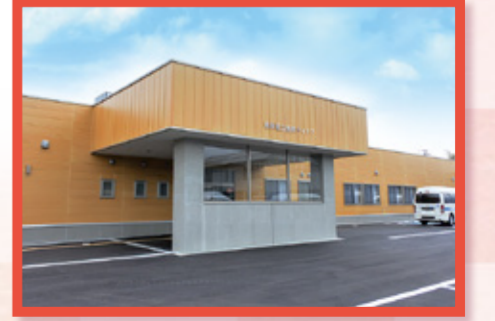
鶴岡協立病院 デイケア新築移転