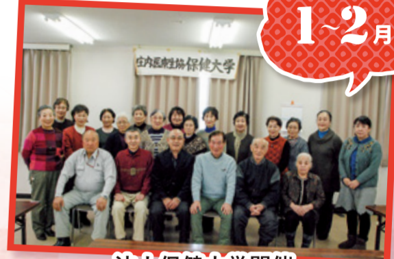
法人保健大学開催