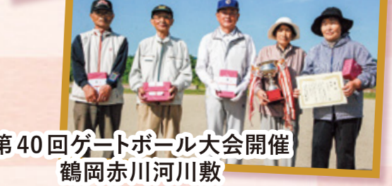
第40回ゲートボール大会開催 鶴岡赤川河川敷