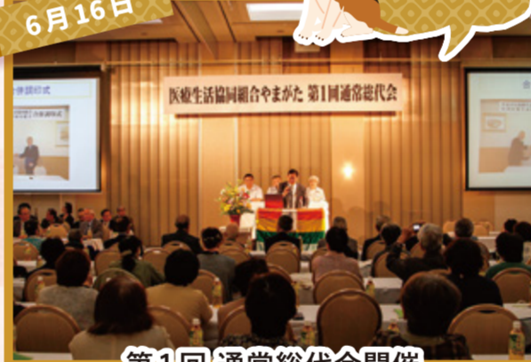
第1回 通常総代会開催