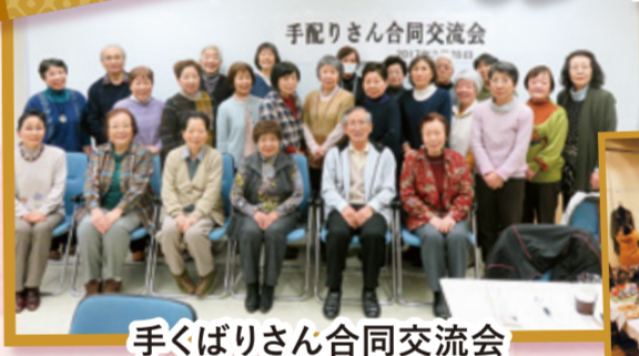
手くばりさん合同交流会 山形市総合福祉センター