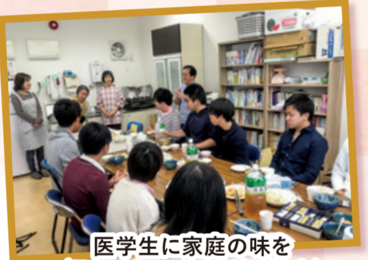
医学生に家庭の味を (ランチミーティングに協力)