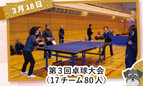
第3回卓球大会 (17チーム80人)