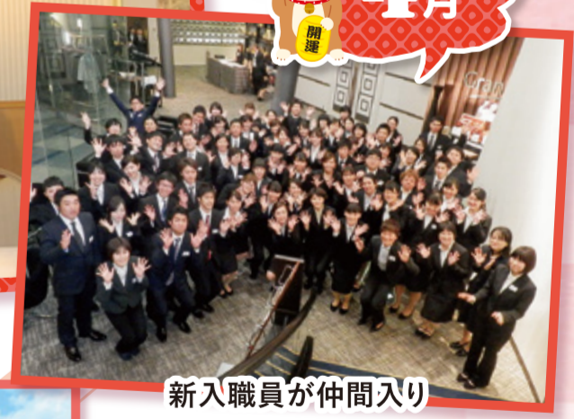
新入職員が仲間入り